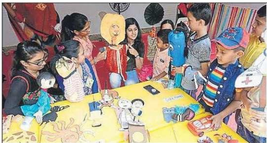
■ Students engaged in activities at Balnagari, organised at Saraswati School, Naupada on Saturday

The school premises is decorated with paintings and colourful informative charts.